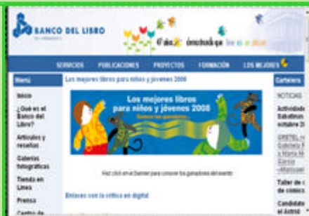
Edición digital Banco del Libro

Banco del Libro es la edición digital de la Asociación Civil "Banco del Libro" publicada para orientar a los padres, maestros y bibliotecarios en el fomento de la lectura de diversos y excelentes libros en el hogar, la escuela y la biblioteca. Esta misión se logra con investigación, experimentación, innovación y divulgación de acciones dirigidas a niños y jóvenes para su formación como lectores. En el portal se encuentra la sección de los servicios que se presentan a los usuarios relacionados con el bibliobús, el Centro de Documentación, librería, el Servicio de Información Personalizada, clubes de cuentos y novelas, canje y donaciones, alquiler de salas, visitas guiadas y actividades sabatinas. Cuenta con enlaces que permiten acceder a las secciones de publicaciones (catálogo) y "Colecciones Formemos Lectores" que ayudan a fortalecer los vínculos de los niños con la lectura. También está la sección que permite conocer los siguientes proyectos: "Entre la lectura y la escritura", "Tendiendo puentes" y "Leer para vivir".