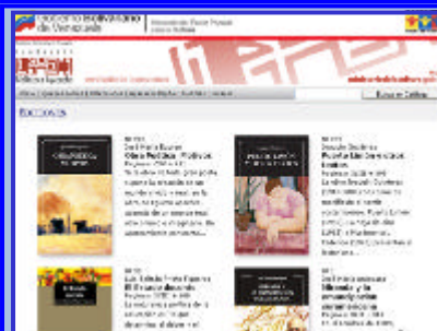
Obras clásicas gratuitas

editados desde 1974 hasta nuestros días. La mayoría de ellos presenta el texto completo en formato PDF y puede descargarse gratuitamente.