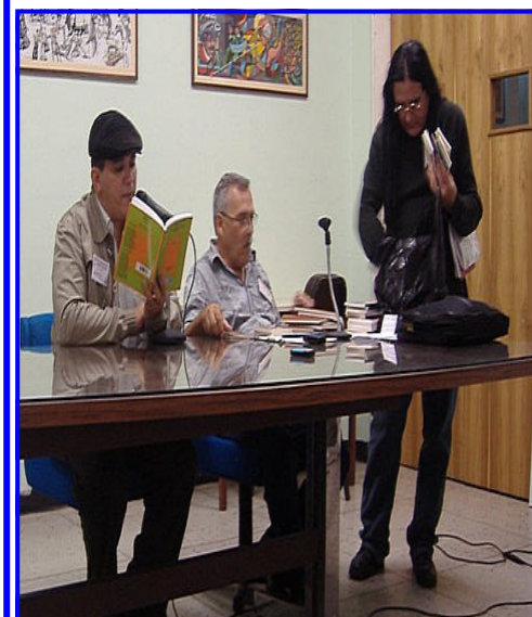
Recital de poesía, en la ULA

se está acabando con la libertad, la universidad y la república y no decir nada", por lo cual ha decidido, después de 5 años sin publicar, volver a presentar sus pensamientos sobre la realidad sociopolítica de Venezuela. Además, hizo un llamado al habitante culto a expresar con libertad sus ideas al respecto. Finalmente, conviene enfatizar que estos espacios literarios propician la discusión y la construcción de diversos criterios que sirven de base a una cultura verdaderamente democrática.