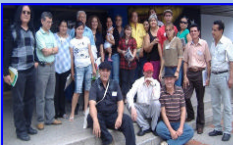
Grupo de Escritores

Del 29 de octubre al 1 de noviembre se celebró en San Cristóbal, capital del estado Táchira (Venezuela) el XVII Encuentro de Escritores Colombo Venezolano utilizó el lema "Nueva visión social del escritor" el mismo fue organizado por la Asociación de Escritores del Estado Táchira y la Asociación de Escritores del Departamento Norte de Santander, de Colombia y tuvo como sedes alternas a las poblaciones de Rubio y Colón.