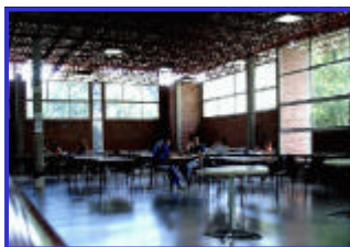
Mesas de Estudio

La Biblioteca "Luis Beltrán Prieto Figueroa" pertenece a los Servicios Bibliotecarios de la Universidad de Los Andes Núcleo Táchira (SERBIULA) que dependen directamente del Vicerrectorado Académico. SERBIULA está conformada por 20 bibliotecas y 3 centros de referencia especializados, poniendo a dis-