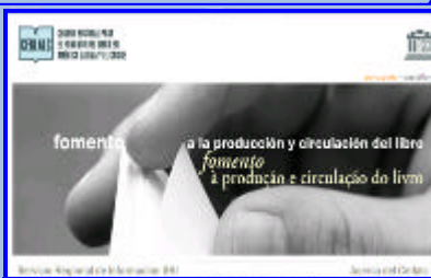
Portada de la página Web

El Centro Regional para el Fomento del Libro en América Latina y el Caribe ( www.cerlalc.org ) es un organismo iberoamericano que trabaja en beneficio del desarrollo de la región a través del establecimiento de sociedades lectoras. Cuenta con el apoyo de las instituciones gubernamentales como los ministerios de cultura y de educación de cada país. Esta organización posee un espacio virtual que contiene una amplia gama de datos, los cuales permiten a los amantes de la lectura mantenerse informados sobre las más recientes publicaciones de libros y su distribución a nivel nacional e internacional, autores destacados, estrategias de trabajos para el aula, oportunidades de formación profesional, enlaces a revistas electrónicas, descargas, eventos especiales y la red de librerías y bibliotecas públicas en Iberoamérica, entre otros. Este