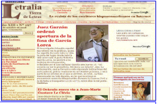
Espacio digital de Letralia

Letralia , tierra de letras, se erige como la primera revista literaria en formato electrónico publicada en Venezuela (1996), tiene como finalidad promocionar las obras de escritores contemporáneos, especialmente de los más jóvenes, aparece en formato digital el primer y tercer lunes de cada mes. Esta revista es un proyecto comunicacional de Jorge Gómez Jiménez, escritor venezolano, quien apuesta por las posibilidades de Internet para dar a conocer el trabajo de escritores hispanoamericanos. En sus diferentes secciones, el lector podrá encontrar noticias del ambiente literario internacional, información sobre congresos, eventos y novedades editoriales, material periodístico, publicaciones (ensayos, poemas, obras de teatro, entre otras) elaboradas por escritores hispanoamericanos, reseñas y cartas de los lectores. La suscripción a esta revista es totalmente gratis y los contactos pueden realizarse a través del correo electrónico info@letralia.com .